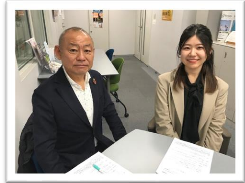
▲ラジオ出演前の二人

ラジオではクラウドフェアの紹介をさせていただき、放送後にはラジオをお聞きの方からのお申込みもありました。ありがとうございました！